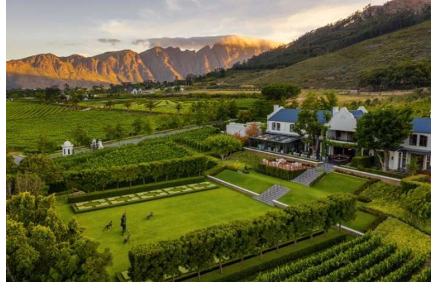
Boschendal Wine Estate