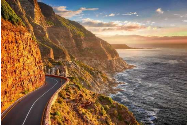
Chapman´s Peak Drive