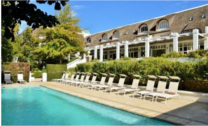
Le Franschoek Hotel & Spa